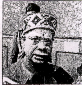
सोलन में पत्रकारों से बातचीत करते राज्यपाल शिव प्रताप शुक्ल।

सोलन। राज्यपाल शिव प्रताप शुक्ल ने कहा कि विश्वविद्यालयों में प्रवेश लेने से पहले हर छात्र को अब शपथपत्र देना होगा कि वह नशा नहीं करेगा। उन्होंने कहा कि विवि के कुलाधिपति होने के नाते मैंने अपने सचिव को कहा है कि वह सभी विवि को निर्देश जारी करें कि वह हर छात्र से शपथ पत्र लें।